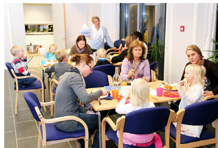
Før barnesangen starter i Asak kirkestue, samles man til middag. Det er barnesang annenhver onsdag.

Noen av våre menigheter går nye veier i trosopplæringen denne høsten