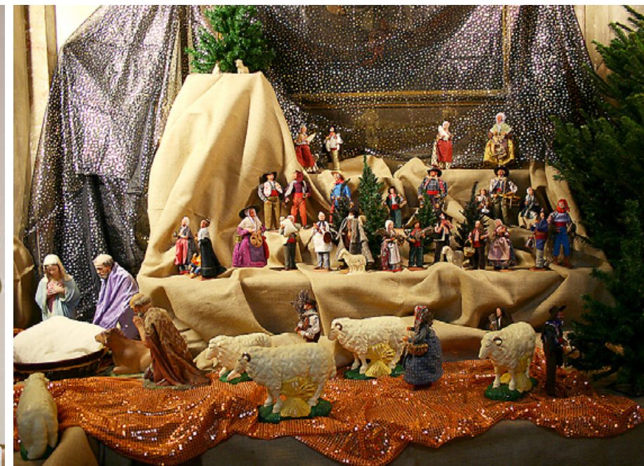
Julekrybbe fra Eze i Syd-Frankrike.

Allerede på 900-tallet ville prestene i den romersk-katolske kirke gjerne levendegjøre juleevangeliet for folk. De begynte å oppføre julespill i kirkene. Disse spillene ble en storartet opplevelse med lys, musikk, deklamasjoner og opptog i den mørkeste tiden på året og de ble mektig populære.