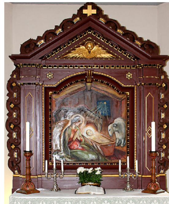
En julekrybbe pryder altertavlen i Tistedal kirke.