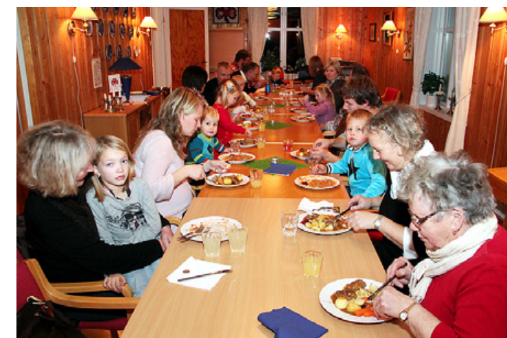
På Karlsholm er flere familier samlet til middag i forkant av korøvelsene. Idd barnekor har øvelser annenhver onsdag.