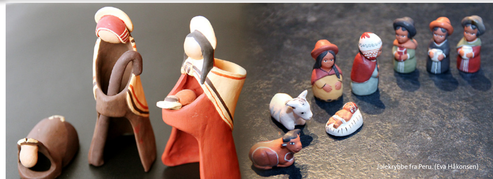
Julekrybbe fra Peru. (Eva Håkønsen)

Fellesrådet har kontaktet Riksantikvaren vedr. rehabilitering av Rokke kirke. Nytt arbeid må iverksettes fordi pusken skaller av. Denne pusken ble vi pålagt å bruke av riksantikvaren. I tillegg ønsker vi: • sinkrenner på våpenhuset. • etterisolering • sikringsglass • Forbredt parkeringsplass • utvending oppussing av kapellet.